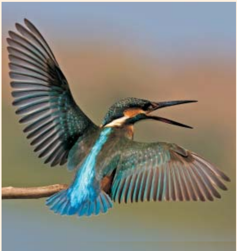
שְׁלֵדֵג גַּמְדִּי נוֹדֵד וְחוֹרֵף בְּיִשְׂרָאֵל The Kingfisher migrates and winter in Israel