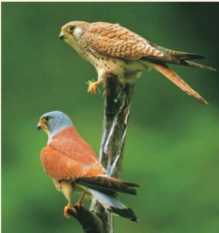
זֶג בָּיִים אֲדוּמִים בְּכַרְמֶל A pair of Lesser Kestrels on the Carmel