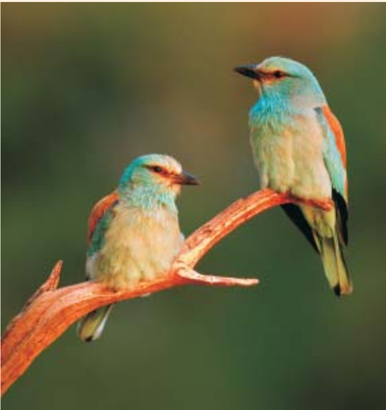
זֶג כַּחֲלִים A pair of Rollers