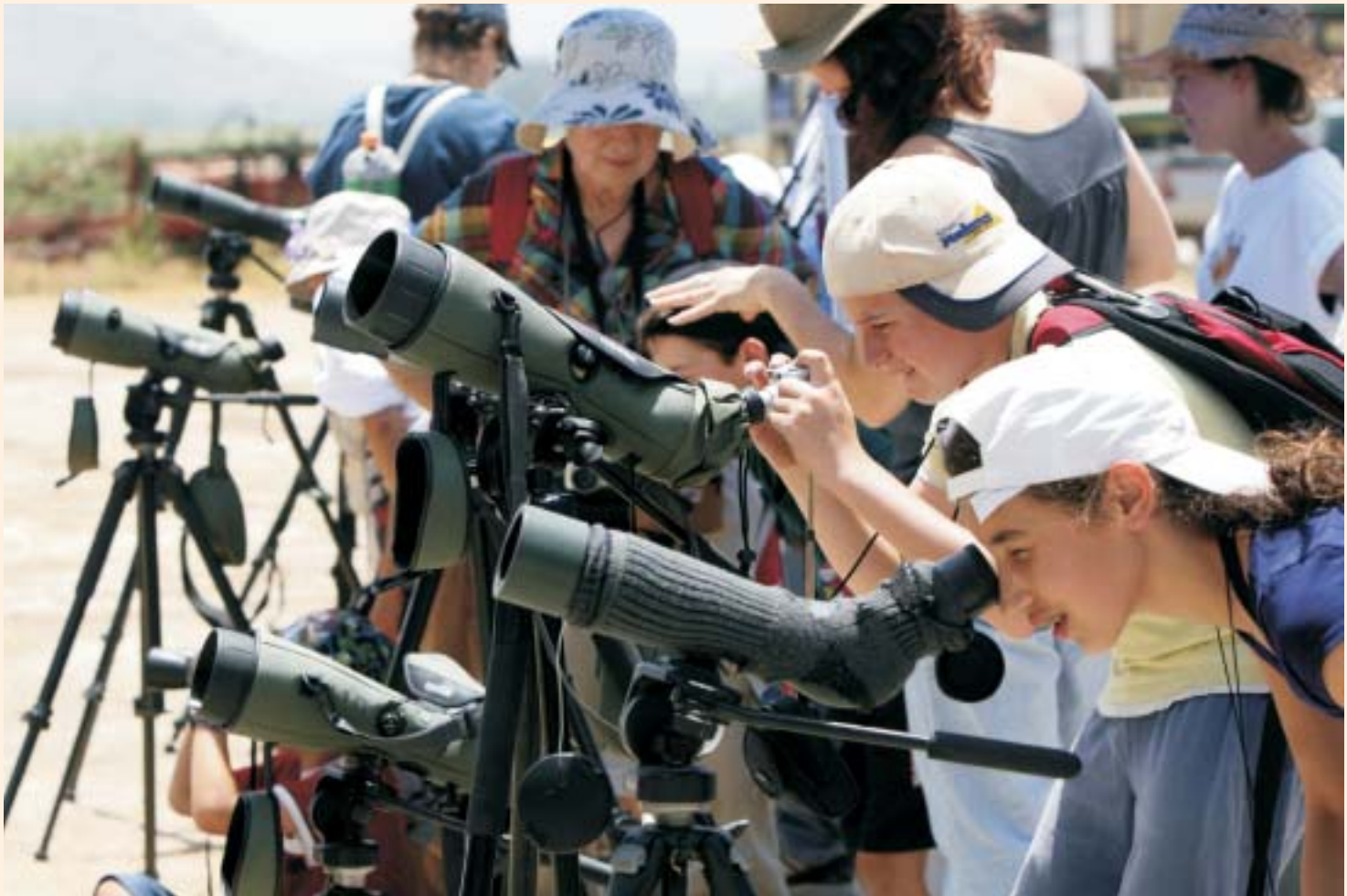
תלמידים צופים בציפורים בעמק החולה.