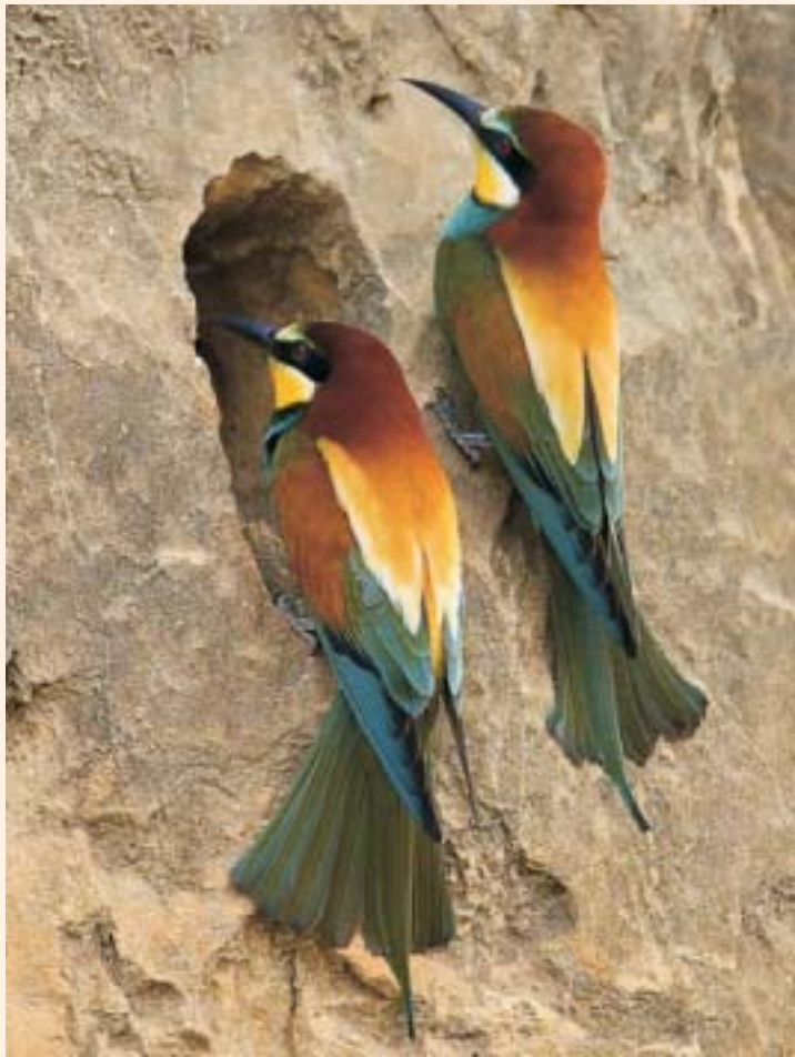
זֶג שְׂרָקֵרִים מְצוּיִים מְקַנְנִים בְּיִשְׂרָאֵל A pair of Bee-eaters nesting in Israel