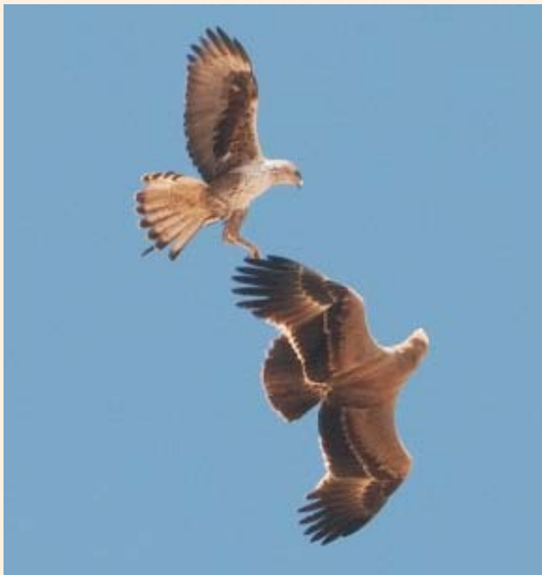
עֵיט נִיצִי חֻקֵּף עֵיט עֶרְבוֹת נוֹדֵד מֵעַל מְצֻק מִדְבַּר יְהוּדָה A Bonelli's Eagle attacks a migrating Steppe Eagle above a cliff in the Judean Desert.