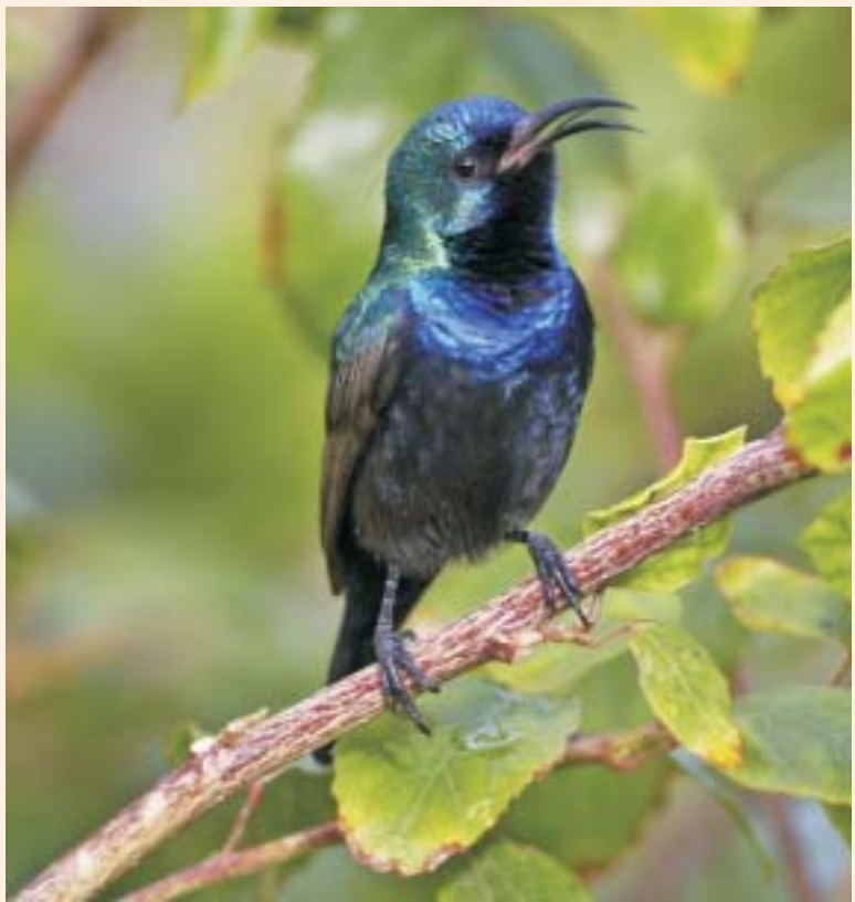
זָכָר צוּפִית A male of Palestine Sunbird